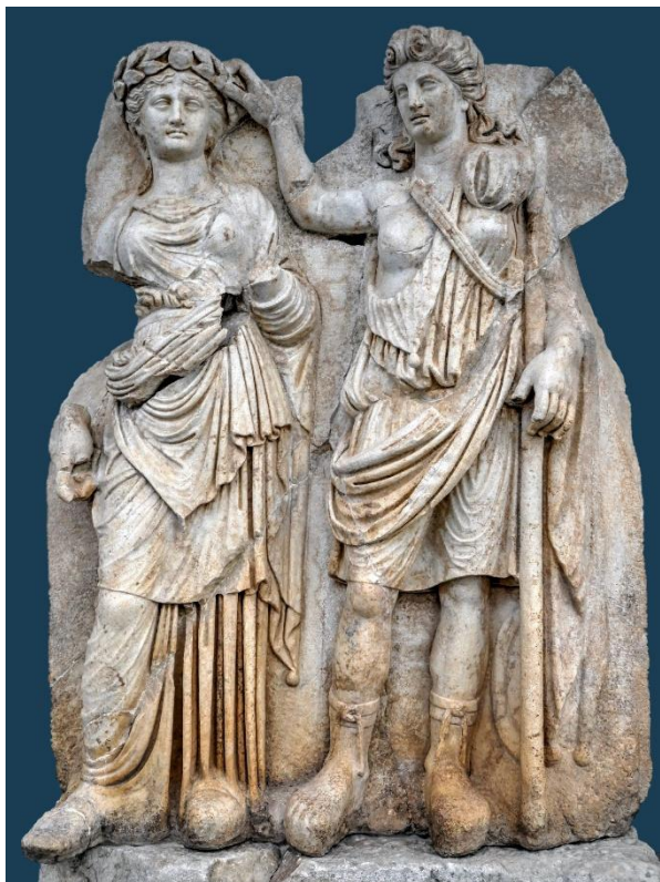
Fig. 9: Afrodisia, Sebasteion. Rilievo con Afrodite e Roma (?). Età giulio-claudia (da https://turkisharchaeonews.net/museum/aphrodisias-museum/ ;).