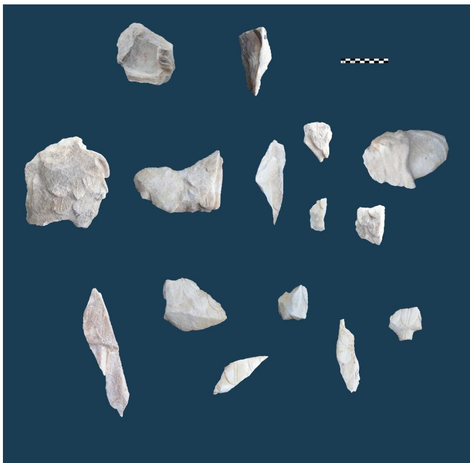
Fig. 4: Hierapolis di Frigia, Santuario di Apollo. Statua di Atena. Frammenti di elmo e di acconciatura (in alto); parte anteriore dell'egida e braccio destro sollevato (al centro); parte posteriore dell'egida (in basso). Età giulio-claudia.

Scolpita di proporzioni superiori al vero, la statua di Atena appare realizzata con grande precisione: la resa dei dettagli risulta, infatti, accurata persino sui frammenti pertinenti alla parte posteriore della scultura, a dimostrazione che l'opera era stata concepita per essere ammirata da vicino e da ogni angolazione. Se il grande formato della statua e la finezza del suo modellato sono evidenti al solo esame autoptico dei frammenti, la ricostruzione sia dell'altezza che del volume dell'Atena hierapolitana si deve alle ricerche condotte da Vincenzo Ria nel quadro del progetto di acquisizione ed elaborazione digitale delle sculture rinvenute nel Santuario di Apollo 20 . In particolare, ai fini dello studio della scultura in esame, fondamentale si è rivelato il confronto tipologico e iconografico con l'Atena in