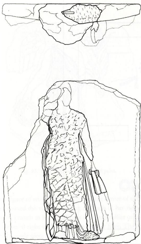
Fig. 10: Afrodisia, Sebasteion. Rilievo con Atena. Età giulio-claudia (da Smith 2011, 149, fig. 93).