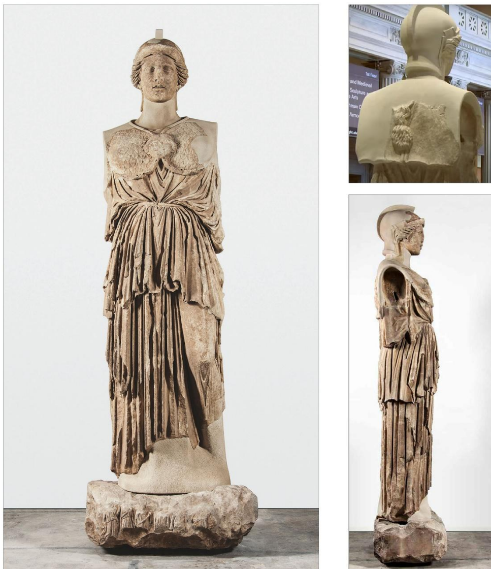
Fig. 6: Pergamo, Santuario di Atena Nikephoros . Statua di Atena Parthenos . 170 a.C. ca. Antikensammlung, Staatliche Museen zu Berlin (da Niemeier 2016, 133; https://www.youtube.com/watch?v=uiBo_OB_toA : 2016© The Metropolitan Museum of Art).

nell'egida pergamena che reca al centro la testa del mostro vista di prospetto e, lungo il bordo, una serie di fori realizzati per l'inserimento di serpentelli, verosimilmente metallici. L'egida pergamena risulta, nel complesso, ben leggibile, nonostante ampie lacune interessino sia il bordo sia il retro del manto che, del tutto privo di scaglie, si presenta liscio (fig. 6).