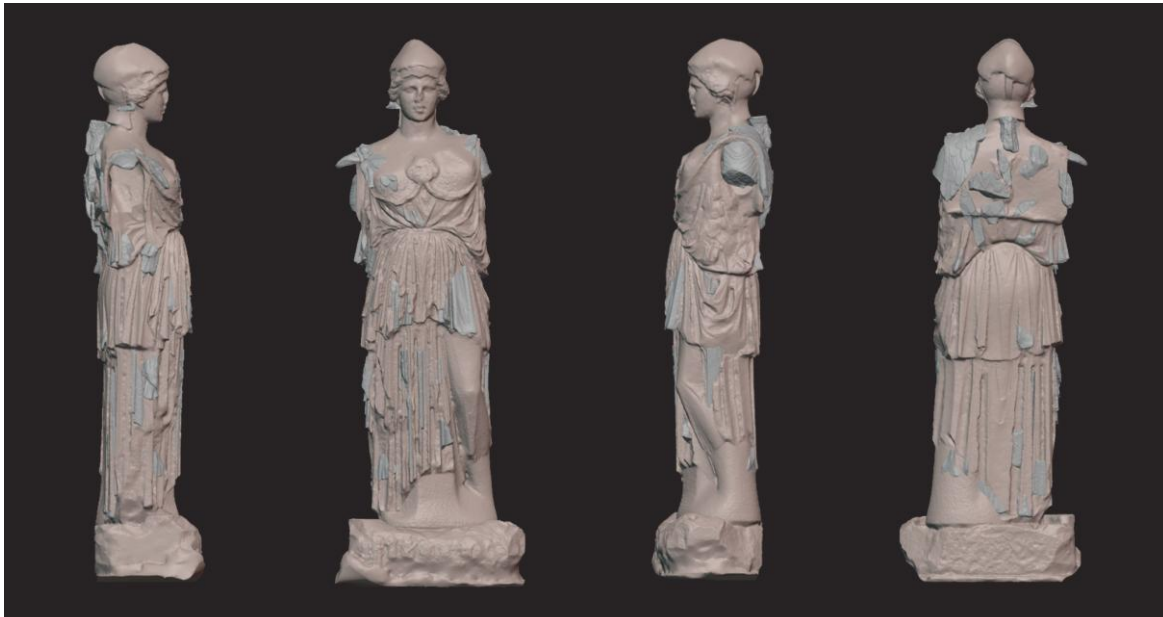
Fig. 7: Statua di Atena dal Santuario di Apollo (Hierapolis di Frigia). Posizionamento virtuale dei frammenti digitalizzati sul modello 3D dell'Athena Parthenos di Pergamo (modello da https://www.myminifactory.com/object/3d-print-pergamon-athena-208722 ).

Sul piano iconografico va sottolineato che l'Atena di Hierapolis indossa il tipo di egida attestato negli adattamenti marmorei di vario formato che – così come l'Atena pergamena – sono ritenuti particolarmente vicini all'originale fidiaco della Parthenos (Atena Varvakeion, Lenormant, di Boston e di Madrid) 27 . Un discorso diverso va fatto per le scaglie dell'egida, che, per forma, dimensioni e caratteristiche del rilievo, variano sempre notevolmente nelle diverse rielaborazioni della Parthenos di Fidia 28 . Sotto quest'aspetto, le scaglie dell'egida di Hierapolis risultano, nella visione di prospetto, più plastiche e liberamente disposte rispetto a quelle dell'Atena pergamena, come anche dei vari adattamenti della Parthenos risalenti a età imperiale 29 .