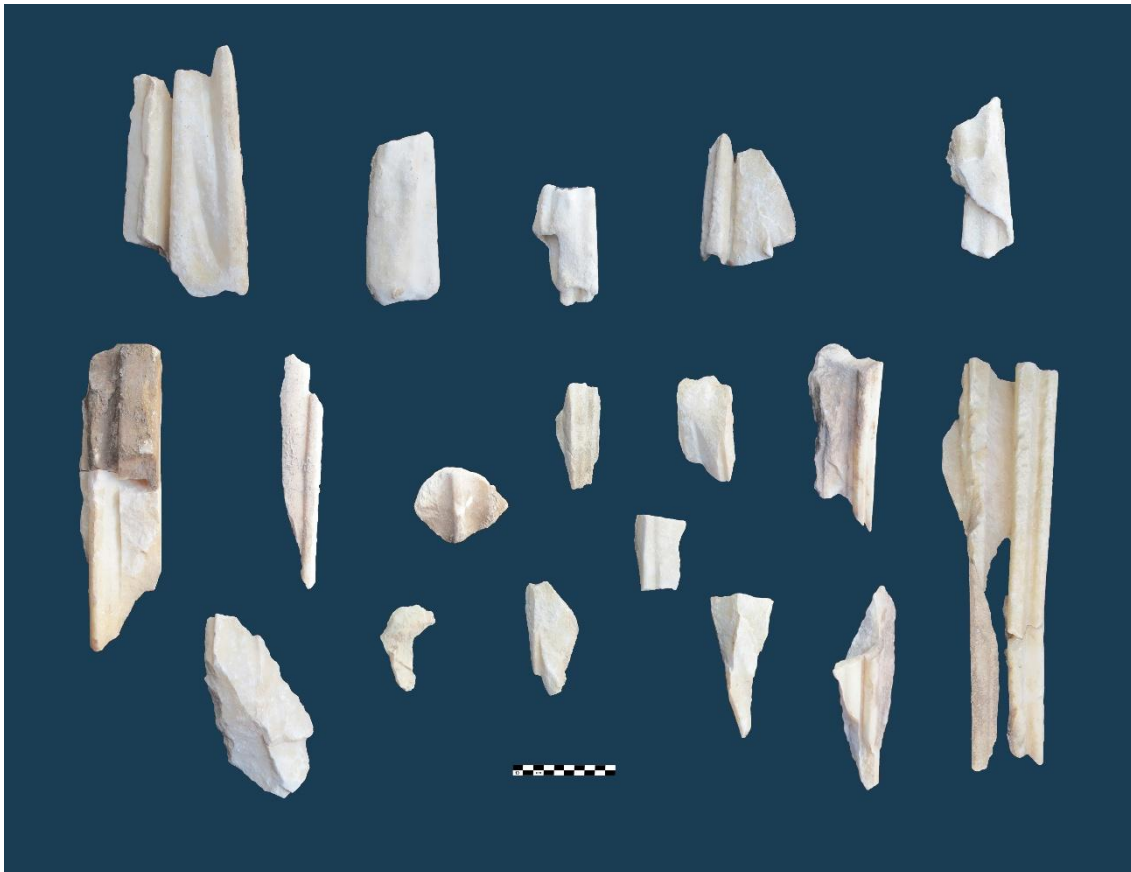
Fig. 5: Hierapolis di Frigia, Santuario di Apollo. Statua di Atena. Frammenti del peplo: panneggio parte superiore (in alto); panneggio parte inferiore (in basso). Età giulio-claudia.

marmo pentelico di Berlino, la colossale statua – scoperta nel 1880 a Pergamo nel santuario dell’acropoli dedicato alla dea Nikephòros – il cui volume originario risulta oggi efficacemente ripristinato grazie a un restauro integrativo di grande impatto visivo effettuato nel 2015, prima del temporaneo trasferimento dell’opera al MET di New York 21 (fig. 6).