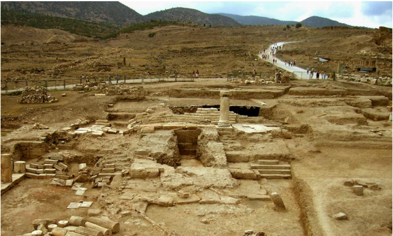
Fig. 2: Hierapolis di Frigia, Santuario di Apollo. Veduta dell'Edificio C, area settentrionale, (scavi 2005).

Atena, divinità attestata a Hierapolis nella documentazione epigrafica, numismatica e nei rilievi di età severiana del teatro (§ 4).