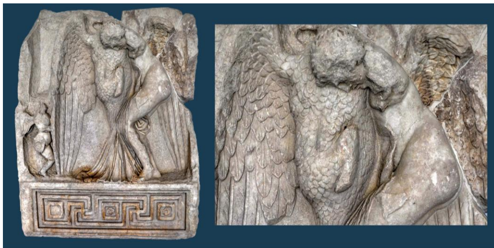
Fig. 8: Afrodizia, Sebasteion. Rilievo con Leda e il cigno. Età giulio-claudia (da https://turkisharchaeonews.net/museum/aphrodisias-museum ;).

Va segnalata, infine, la presenza nel Sebasteion di un rilievo gravemente danneggiato, ma comunque leggibile, che documenta nel repertorio degli scultori afrodisiensi l'immagine di Atena stante e in peplo raffigurata – con la stessa ponderazione della statua di Hierapolis – mentre tiene nella destra sollevata la lancia e nella sinistra abbassata lo scudo circolare 38 (fig. 10).